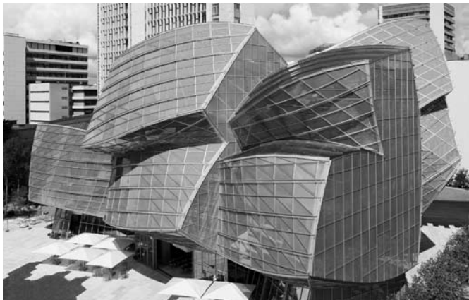
Gehry-Bau an der Fabrikstrasse 15, das markanteste Gebäude des Campus-Areals.

Bis zu 10'000 Menschen sollen mittelfristig auf dem Novartis-Campus ein optimales Umfeld für Innovation und Forschung finden. FUB-Mitglieder konnten sich vom Geschehen auf dem Novartis-Campus, seinen Hintergründen und Zielen ein Bild machen.