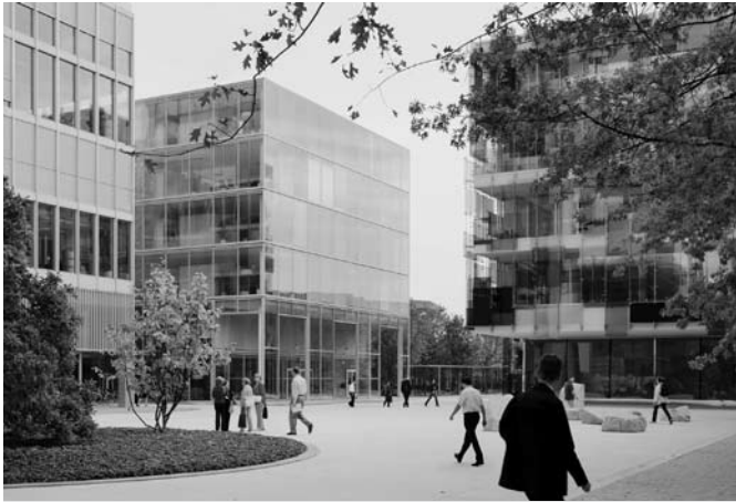
Kein Gebäude ist gleich wie das andere – gemeinsam schaffen sie Raum und Struktur.

hüningen und im Auhafen entstanden sind. Der Hafen wird danach zurückgebaut. An seiner Stelle entsteht eine neu gestaltete Uferzone, von der auch die Be-