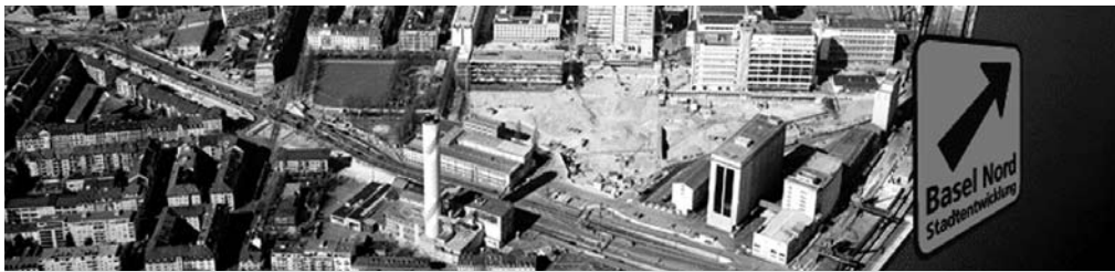
«Campus plus» bezeichnet die Erweiterung zum Rhein hin. Ende 2009 ist der Hafenbetrieb zu Ende. Eine neuer Rheinuferweg und das Universitätsgelände «Volta» sollten dort entstehen.

dischen Standorten sind es zusammen 1'420 Millionen. Zur Zahl der Beschäftigten brachte der Gastgeber dann noch eine kleine Korrektur an: Zu jenem Zeitpunkt waren auf der Baustelle des Campus zusätzlich rund 600 bis 800 Bauarbeiter am Werk.