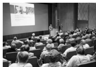
FUB-Mitglieder im Auditorium: Was ist der Campus eigentlich?

Damit werden Investitionen für eine prosperierende Entwicklung unserer Region getätigt. Gerade in der Finanz- und Wirtschaftskrise ist es entscheidend, an der Zukunft zu bauen und Voraussetzungen zu schaffen, dass wir als innovativer, wertschöpf-