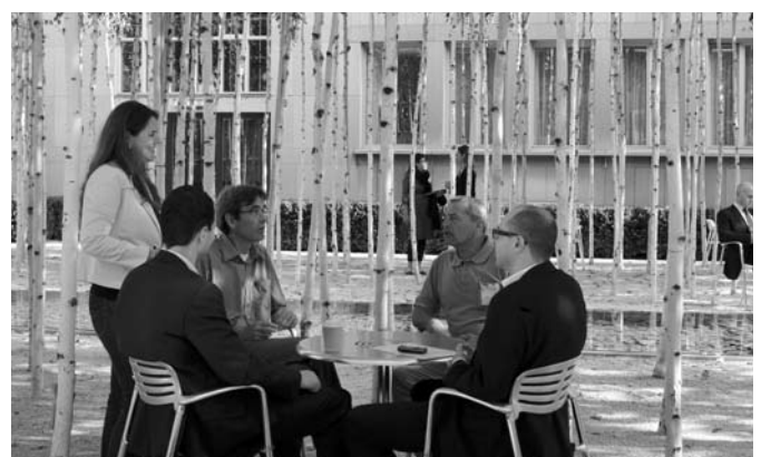
Ambiente der Begegnung und des Austauschs im Birkenhain.