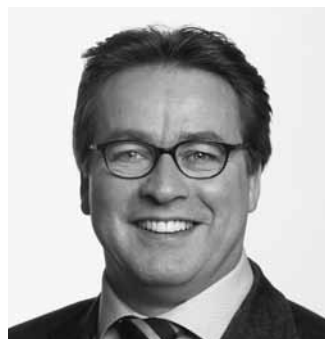
Regierungsrat Urs Wüthrich-Pelloli, Vorsteher der Erziehungs-, Kultur- und Sportdirektion des Kantons Basel-Landschaft

Im feierlichen Ornat zogen die Würdenträgerinnen und Würdenträger der Universität Basel am 17. April 2010 in die Stadtkirche in Liestal ein. Fast schien es, als würde der Dies Academicus in Liestal abgehalten. Aber keine Ehrenpromotionen wurden vergeben, sondern es ging um die festliche Eröffnung des 550-Jahre-Jubiläums. Umrahmt von Musik und szenischen Impressi-