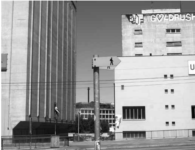
Rückbaustelle St. Johann mit deutlichem Weg-Weiser.

beurteilt, ein wichtiger oder ein verkräftbarer. Er betrifft aber nur die für «Volta» vorgesehenen Disziplinen. Die anderen Planungen sind davon nicht betroffen.